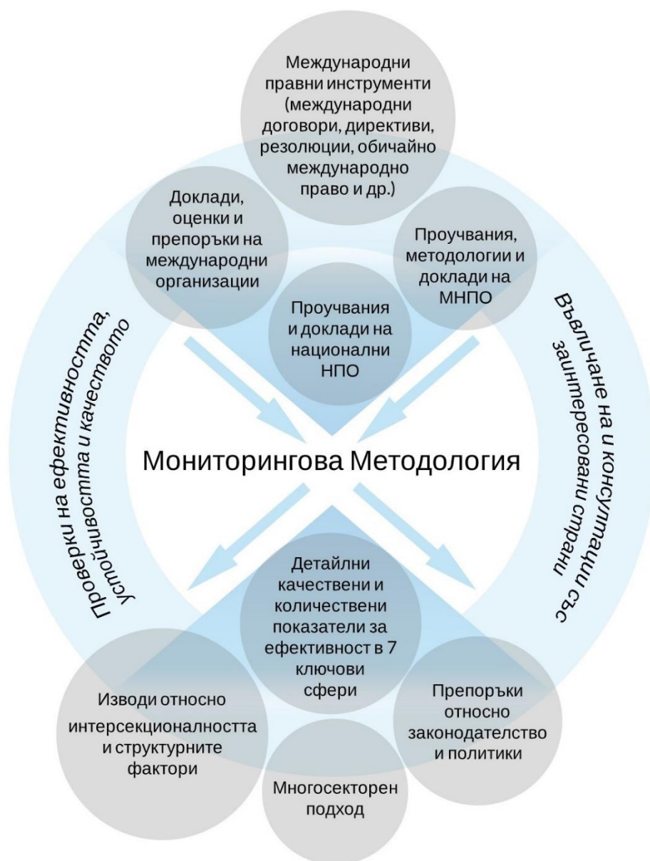
Фигура 1. Източници и очаквани резултати на методологията

Една от ключовите цели на мониторинговата методология, която в момента се разработва от Центъра и партньори, е да спомогне за идентифицирането на слабостите в съществуващата система за противодействие на ДННОП и да предложи конструктивни и базирани на доказателства насоки за преодоляването на тези предизвикателства.