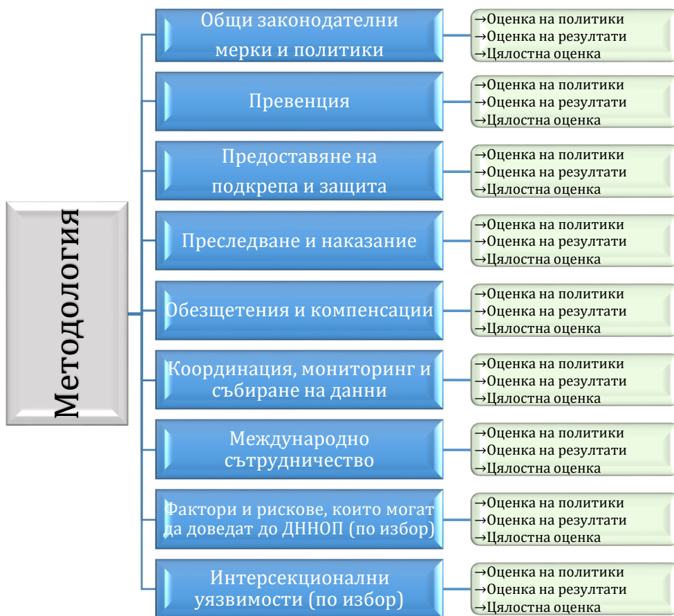
Фигура 2. Нива на анализ и тематични области