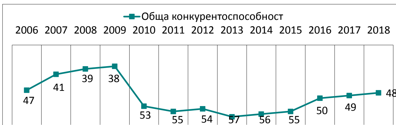
ФИГУРА 1. ОБЩА КЛАСАЦИЯ НА БЪЛГАРИЯ 2006-2018 Г.

Източник: Годишник на световната конкурентоспособност, 2018.