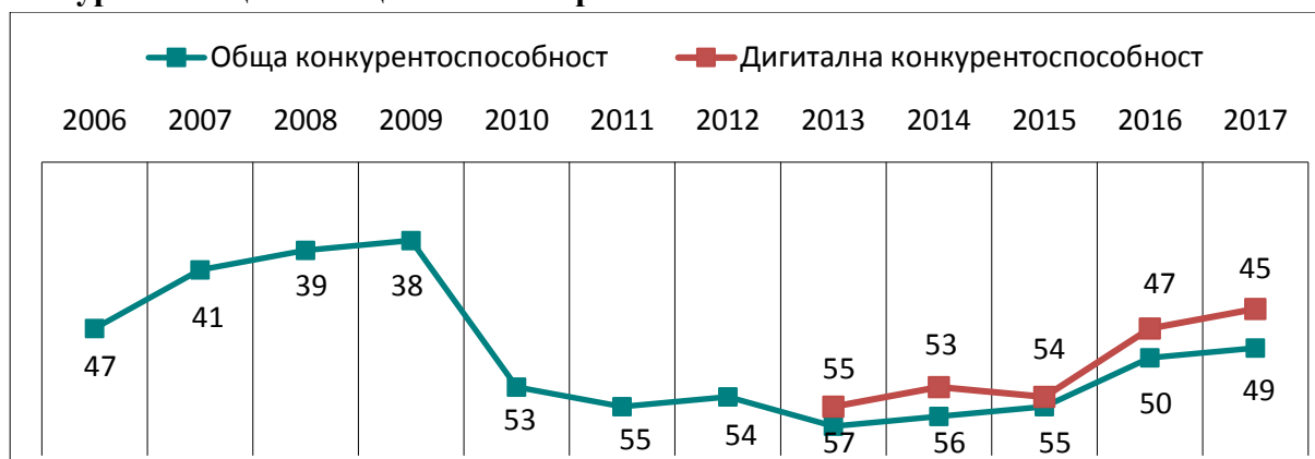
Фигура 1. Обща класация на България 2006-2017 г.

Източник: Годишник на световната конкурентоспособност, 2017.